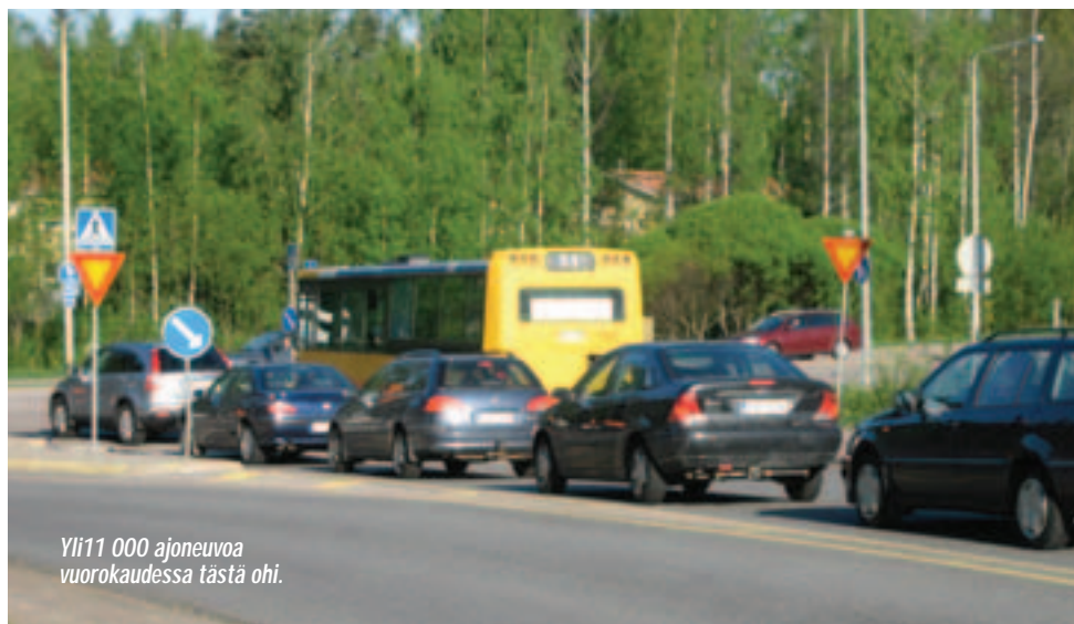
Yli 11 000 ajoneuvoa vuorokaudessa tästä ohi.

kaavamuuoksella mahdollistetaan liiketoiminnan kehittäminen. Ja samalla yritetään huomioida liikenteen sujuminen. Onko- han liikenneym- pyrät keksitty vasta viime vuosina vai ovatko ne liian helppoja ratkaisuja, Häkkinen virnuilee.