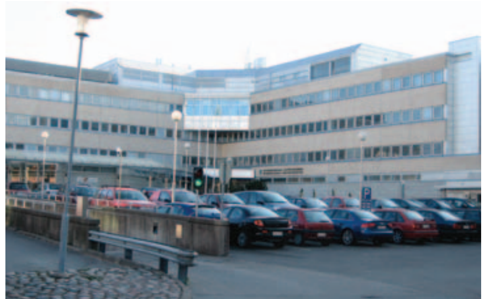
Myyrmäen sosiaali- ja terveysasema sai iltavastaanoton.

"- Palvelutarjonnan on tuettava kaupunkilaisten arkea eikä vanhoja rakenteita"