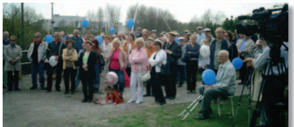
Vappujuhla keräsi kuulijoita kotirintamamuistomerille.